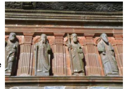
A droite : apôtres sur la façade de l'ossuaire de Sizun