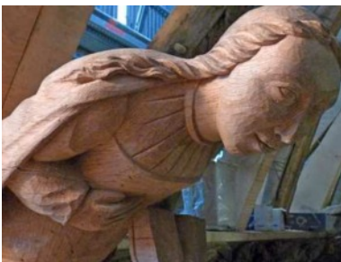
A gauche : blochet de l'église de Dirinon

Nous en reparlerons dans une prochaine newsletter,